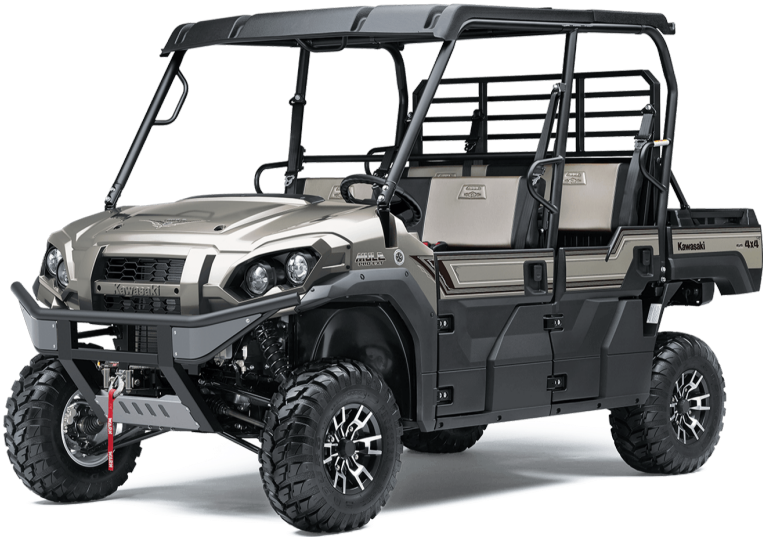
GRIS METALLIC TITANIUM